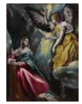
エル・グレコ(受胎告知)

エル・グレコ、モネ、マティス……大原美術館の礎となる名画コレクションの初公開は、約100年前、倉敷の小学校で開催された三つの展覧会でのことでした。美術品収集開始から100年、美術館開館90周年を記念する本展では、これら三つの展覧会を振り返り、人々を熱狂させた“倉敷の奇跡”の歴史的意義について考えます。