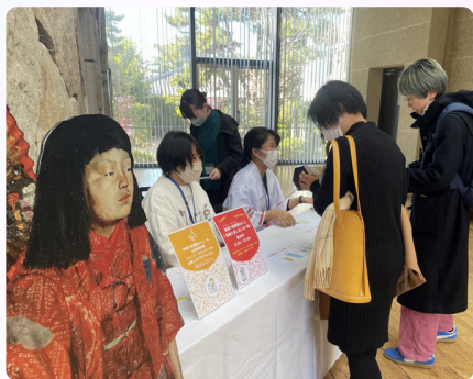
▲ワークショップの様子