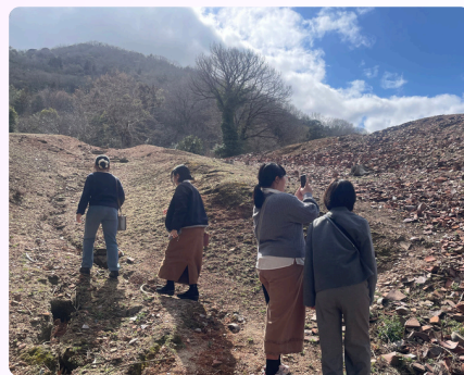
▲他施設見学の様子