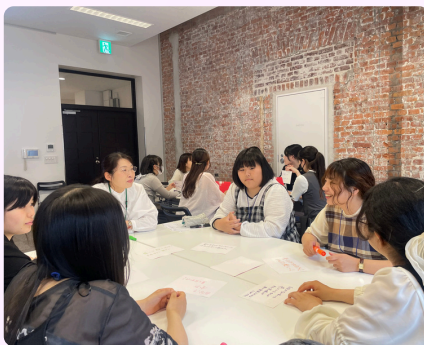
▲ミーティングの様子